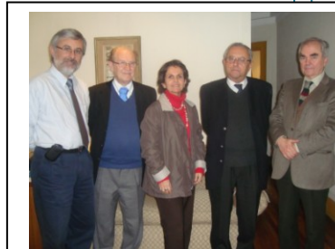
▲ Consejo Acreditador de Especialidades Primarias del Área Médica.